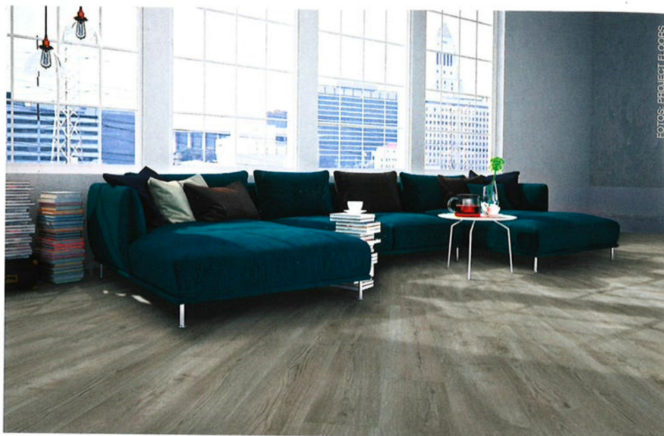
Die beiden Hauptkollektionen von Project Floors, floors@work für das Objekt und floors@home für das Zuhause, erhalten zum Jahresbeginn 2023 einen Relaunch. Im Bild: das neue Dekor PW 3262.

Der LVT-Spezialist Project Floors präsentiert Anfang 2023 eine Überarbeitung der beiden Hauptkollektionen floors@work und floors@home. Aktuelle Farbtöne ergänzen das Angebot an authentischen Holz- und Steinnachbildungen. Ein neues, größeres Format bei den Fischgrätplanen bietet jetzt noch mehr Möglichkeiten für eine individuelle Bodengestaltung. Neben bekannten Klassikern finden sich elf neue Holzöne und die beliebtesten Eiche-Dekore der OAK Selection im Standardangebot. „Der Dauerbrenner Beton und viele Grautöne bis hin zu Anthrazit werden gut angenommen, während Beige und Brauntöne weniger nachgefragt und daher in der Neuauflage der Kollektion nicht mehr so zahlreich vertreten sein werden“, sagt Marketingleiter Marco Knop. Mit den zwölf neuen Fliesendekoren ziehen als Neuheit mit dem Relaunch zwei Marmordekore sowie Terrazzo-Nachbildungen in die Kollektion ein. Die floors@work verfügt nun über 87 Dekore (60 Holz- und 27 Steinnachbildungen) zum vollflächigen Verkleben mit einer Nuttschicht von 0,55 mm, die für den Einsatz im Objektbereich prädestiniert sind.