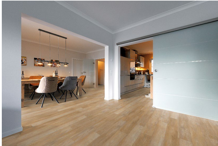
Gezeigtes Dekor: PW 1250

PROJECT FLOORS präsentiert ab Februar 2025 mit der F-SPC COLLECTION Neuheit bei den schwimmend verlegten Designbodenbelägen