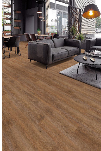
Gezeigtes Dekor: PW 3065