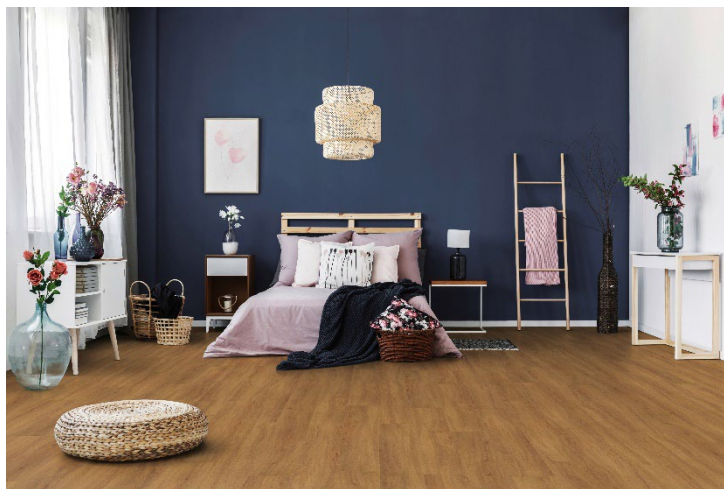
Gezeigtes Dekor: PW 3361

Wie alle Kollektionen ist die F-SPC COLLECTION zusätzlich mit dem Indoor Air Comfort Gold Zertifikat ausgezeichnet. Sie ist frei von Phthalaten, der verwendete Weichmacher ist Hexamoll® DINCH, der von BASF für Anwendungen in engem menschlichem Kontakt entwickelt wurde. Hierzu gehören insbesondere die sensiblen Bereiche Spielzeug, Medizinprodukte oder Lebensmittelverpackungen.