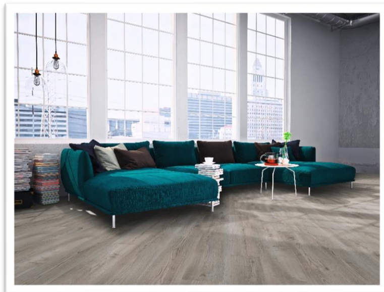
Neues Dekor PW 3262

Aktuelle Farbtöne ergänzen das Angebot an authentischen Holz- und Steinnachbildungen. Und auch bei den Designverlegungen bietet PROJECT FLOORS ab 2023 eine Erweiterung des Sortiments: Ein neues, größeres Format bei den Fischgrätplanken bietet jetzt noch mehr Möglichkeiten für eine individuelle Bodengestaltung und eine tolle Wirkung im Raum.