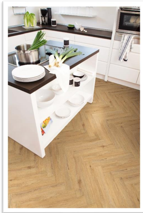
Größeres Fischgrätformat und neues Dekor PW3350/HBL