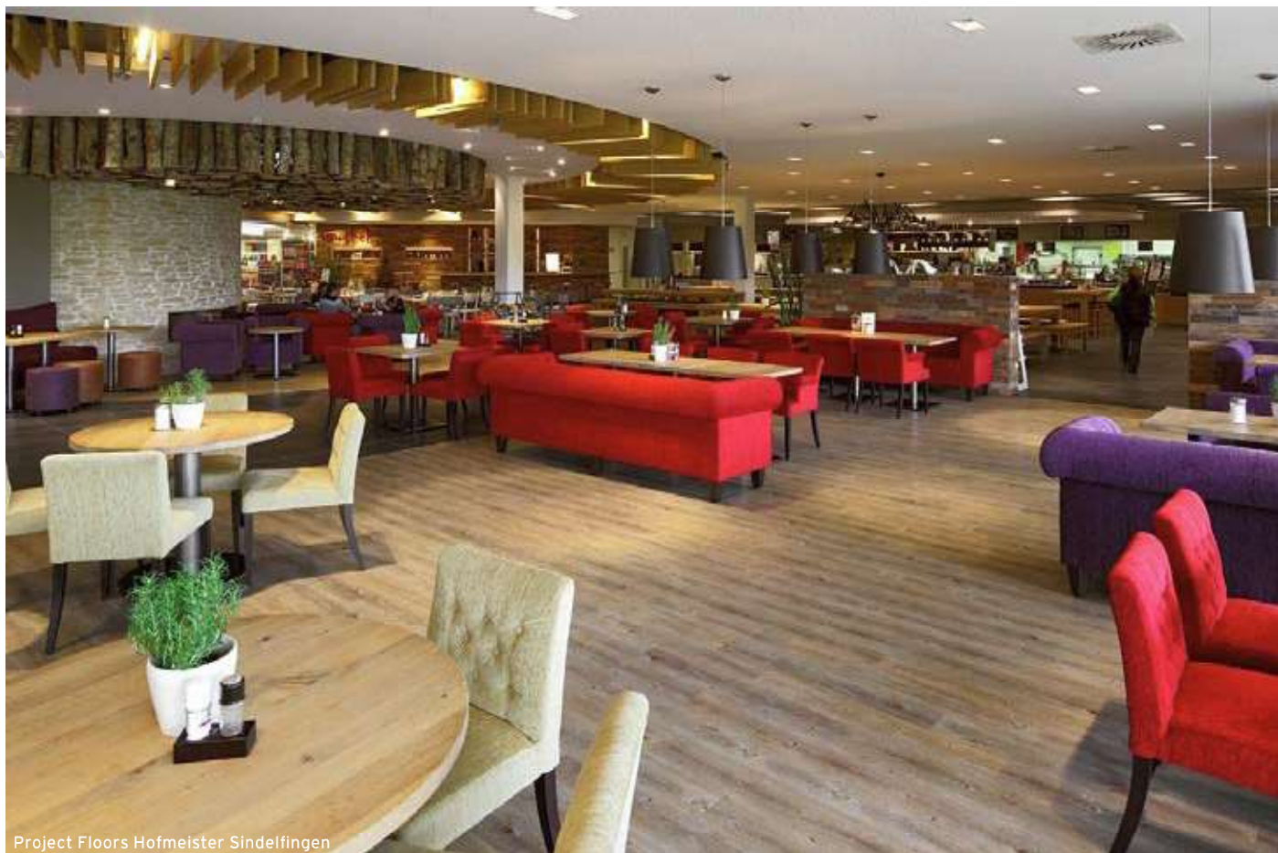
Project Floors Hofmeister Sindelfingen