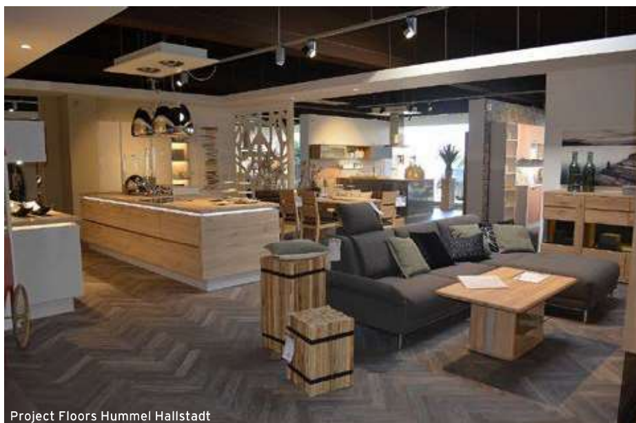
Project Floors Hummel Hallstadt