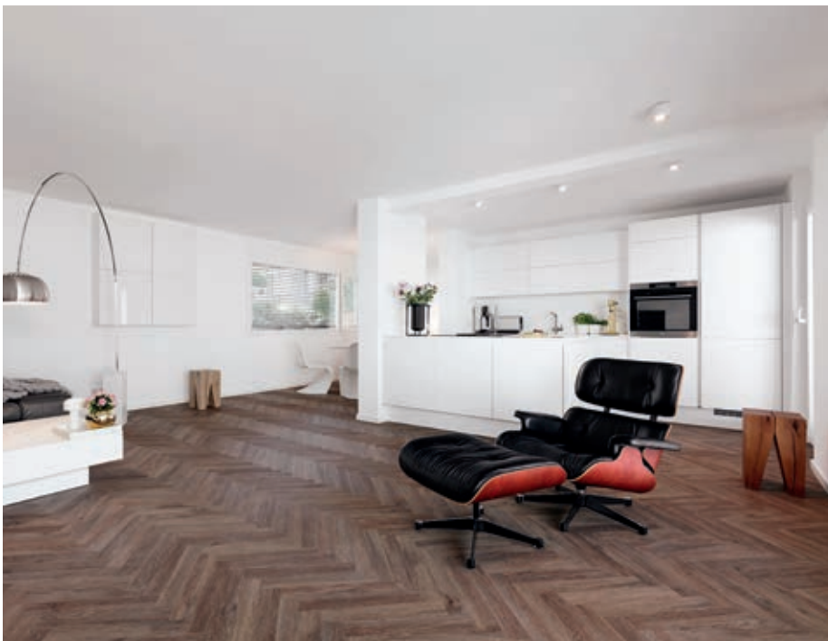
Die dunkle Farbe bildet einen starken Kontrast zu den vorrangig weiß gehaltenen Möbeln.

Tatsächlich lässt die durchgehende Verlegung in Wohn-, Kinder- und Schlafzimmer, offener Küche, Essraum, Diele und Flur, Gäste-WC und bis ins Badezimmer hinein die großzügig geschnittenen Zimmer noch größer wirken. Die authentische Holzoptik am Boden bietet einen perfekten Kontrast zu den weißen Designermöbeln und dem vom Bauhaus inspirierten Einrichtungsstil. Durch das verlegte Fischgrätmuster wird auch der Boden zu einem echten Hingucker. ■